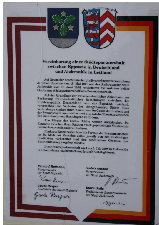
Die Urkunde der Städtepartnerschaft

Wir danken allen Freunden aus Eppstein, Aizkraukle und den anderen Partnerstädten, die wesentlich zu unserer erfolgreichen Arbeit beigetragen haben.